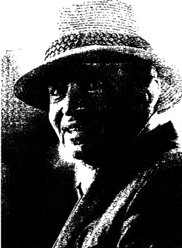
■ في تموز ١٩٨٤ توفي الممثل الاميركي جيسس مايسون